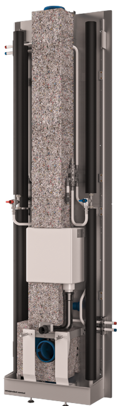
LK Våtrumskassett SAFE Q utan frontplåtar.